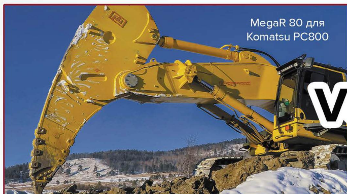
MegaR 80 для Komatsu PC800