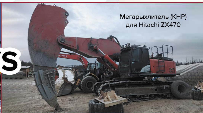
Мегарыхлитель (КНР) для Hitachi ZX470