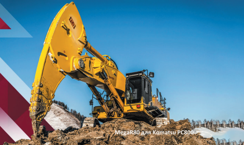
MegaR80 для Komatsu PC800

Компания «Профессионал» - ЛИДЕР российского рынка по продажам Мегарыхлителей в 2023 г. (реализовано более 150 шт.)